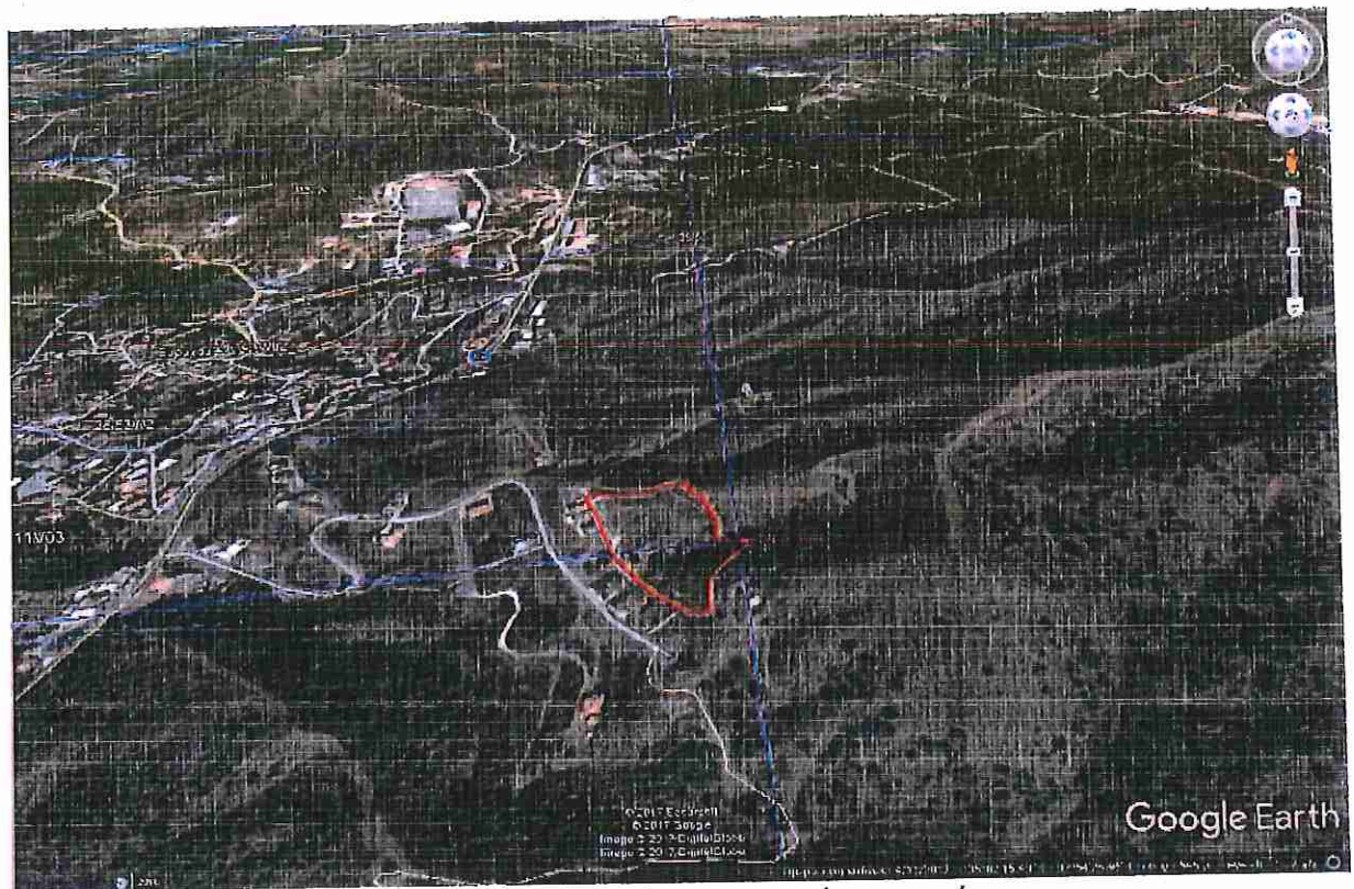
Τηλεσκοπική φωτογραφία της άμεσης περιοχής του ακινήτου